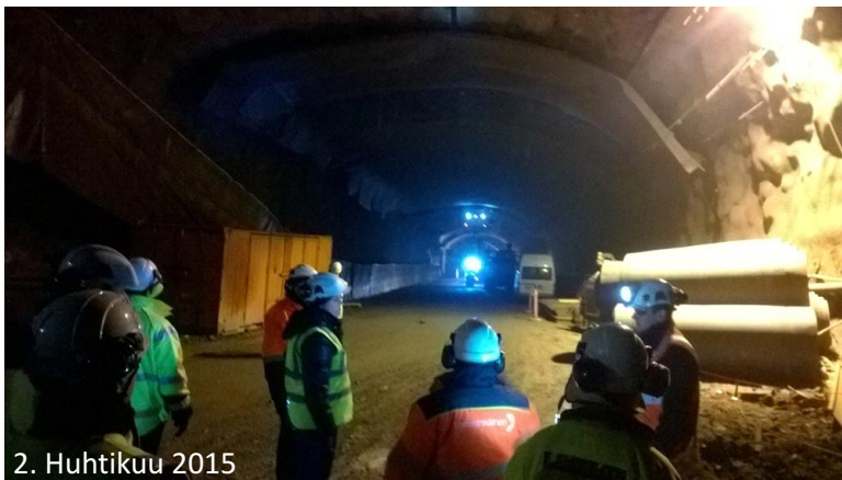
2. Huhtikuu 2015