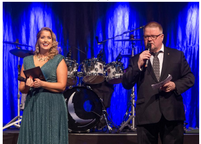
Lauantai loppuillan juontajat