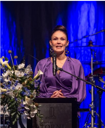
Lauantai juhlapuhe, viestintä- ja liikenneministeri Lulu Ranne