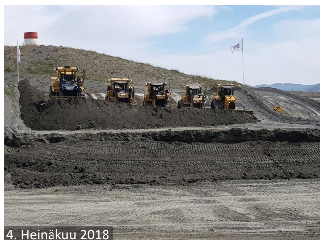
4. Heinäkuu 2018