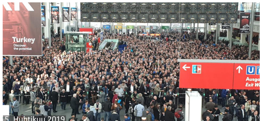
5. Huhtikuu 2019