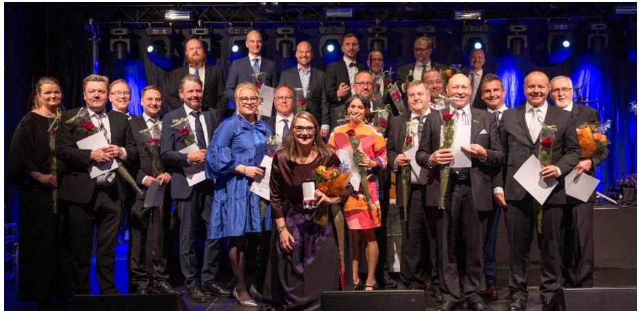
Vuoden 2024 ansiomerkit