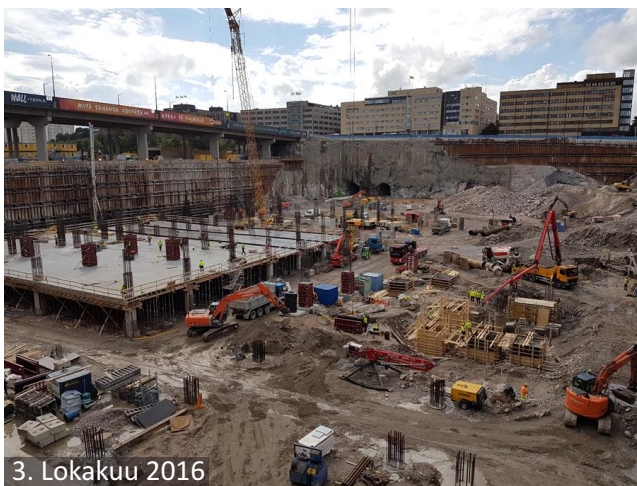
3. Lokakuu 2016