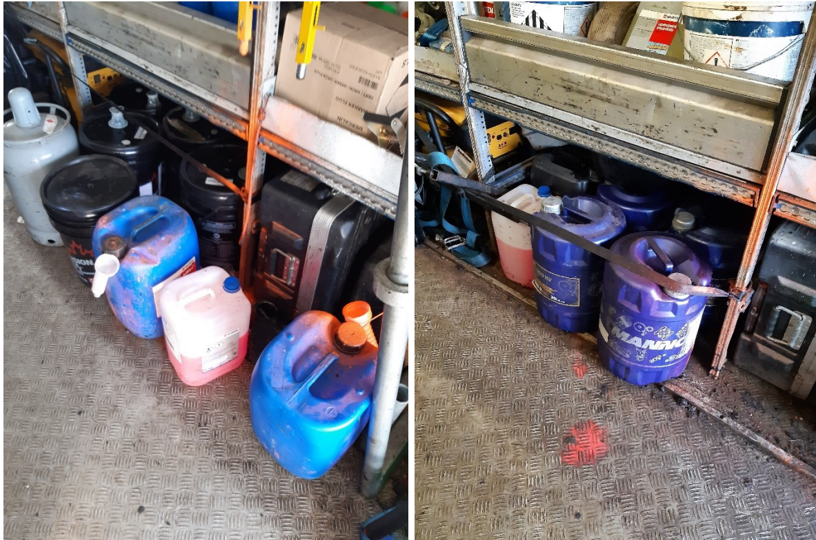
Sama huolto-auto vuonna 2022 ja 2023