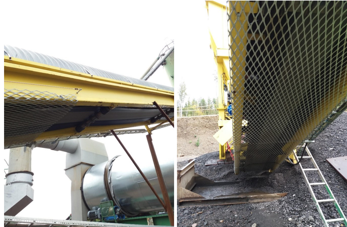
Tarkastuksia tehdään työmaiden lisäksi myös siirrettäville asfalttitehtaille