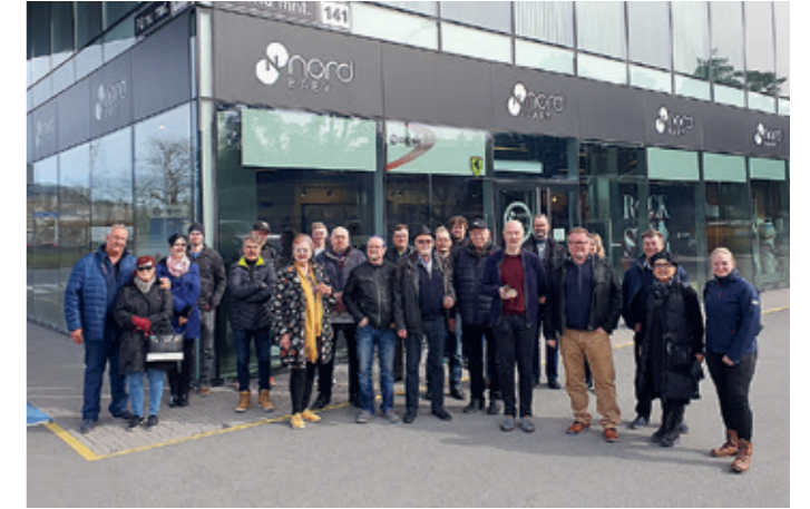
INFRA Keski-Suomi tutustumassa Viron Infran toimintaan 2023.