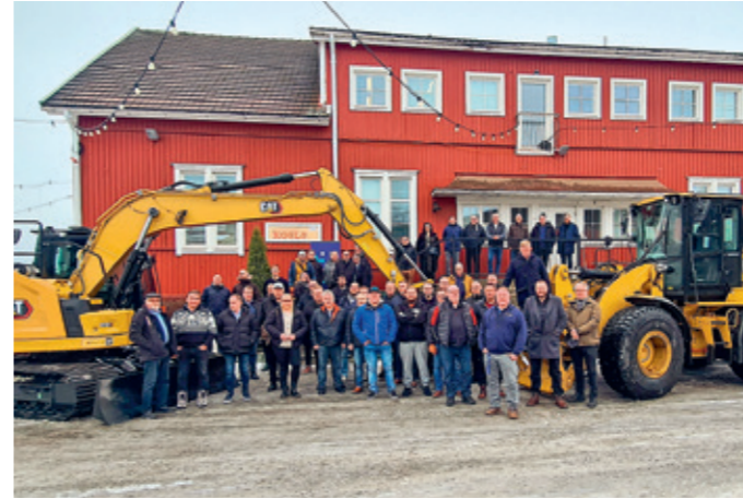
Himos viikonloppu helmikuu 2023

päätoimittaja toiminnanjohtaja INFRA Häme & Keski-Suomi