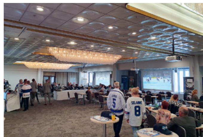
INFRA Hämeen vuosikokous ja MM-kisojen avausottelu Suomi-USA toukokuussa 2023.

näistä yhteisistä tapahtumista on jo pitkät perinteet, mm Himos viikonloppu, joka on järjestetty kuutena vuonna. Viime vuoden tapahtumaan kytkettiin myös kaikki muutkin INFRAn piirihallitukset mukaan. Tästä tapahtumasta tehtiin juttua myös Konepörssi lehden kautta, eli osa INFRAn tapahtumista ylittää media kynnyksen myös hieman isommin.