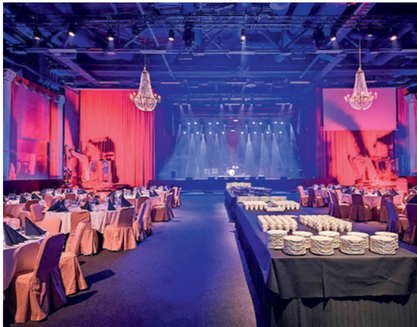
INFRA23 Lappeenranta, hetki ennen kuin salin ovet aukeaa...

250 henkeä, Lappeenrantaan oli ilmoittautunut 300 henkeä ja näillä näkymin Tampereelle mahtuu 400. Eli tarkkaile postiasi ja muista ilmoittautua, kun sen aika koittaa.