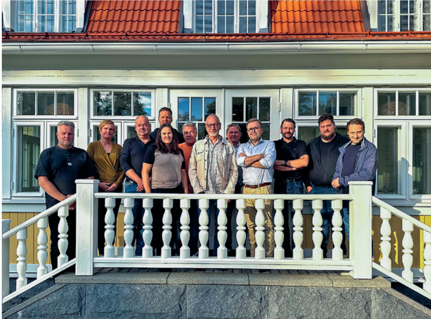
Kuva INFRA Länsi-Suomi ry:n hallitus sekä toimihenkilöt